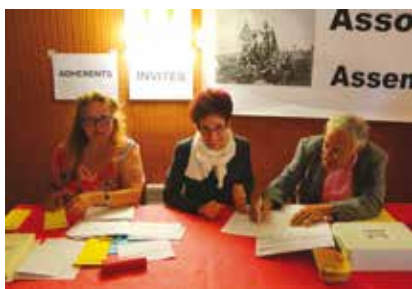
Accueil souriant à l'AG du 23 juin 2018