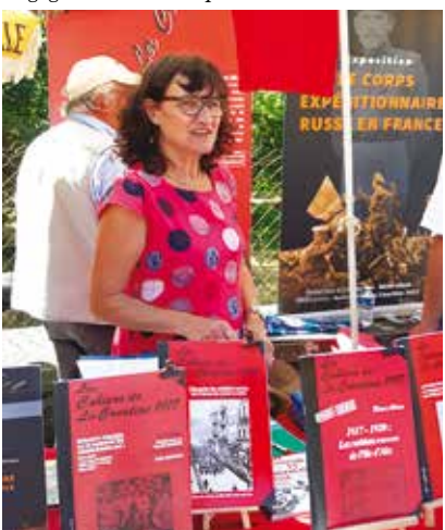
La Courtine 12 août 2018 : le stand de LC1917 à la journée de la grande brocante annuelle