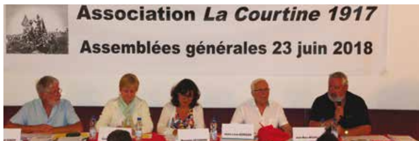
La « tribune » de l'AG