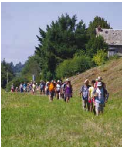
La Courtine 20 août 2018: une cinquantaine de participants à la balade commentée «sur les pas des mutins » avec l'association « Chemins de Mémoire Sociale ». Réception et pot de fin de balade.