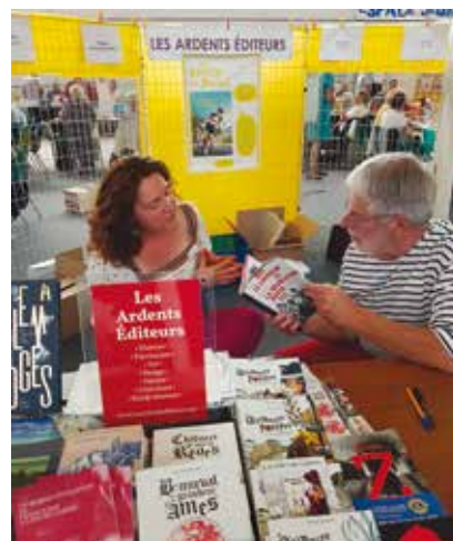
Felletin 10 août 2018 : Stand des Ardents Editeurs avec dédicace du livre « 1917, le Limousin et la révolution russe »