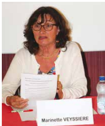
La secrétaire et la trésorière nouvellement élues au bureau de l'association